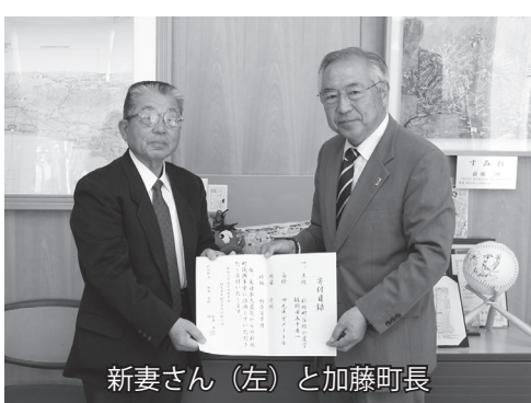
新妻さん（左）と加藤町長