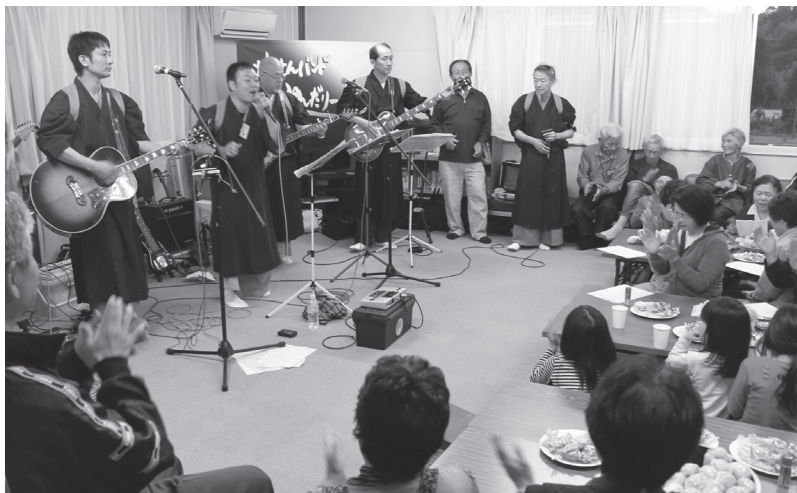
仮設住宅の集会所で披露された坊さんバンド「G ぷんだりーか」によるバンド演奏。多くの方が訪れ、手拍子をしたり、一緒に歌ったりして盛り上がりました。