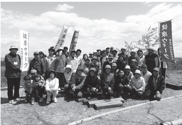
花木山で記念撮影