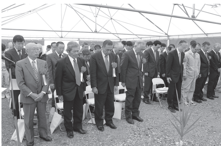
無事故、無災害を願い 執り行われた安全祈願祭