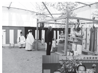
知事、石井副社長 （株）渡辺石油資源開発 社長、内堀県

町では福島県及び事業者である石油資源開発株式会社の三者において立地に関する基本協定を締結し、LNG基地建設計画の円滑な推進に取り組んでいます。