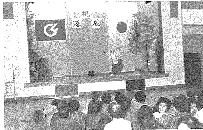
▲地区民とともに盛大に行われた落成式