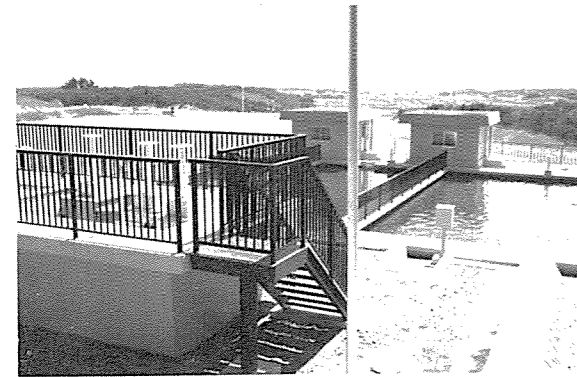
▲鴻ノ巣ダム西に建設した浄水場