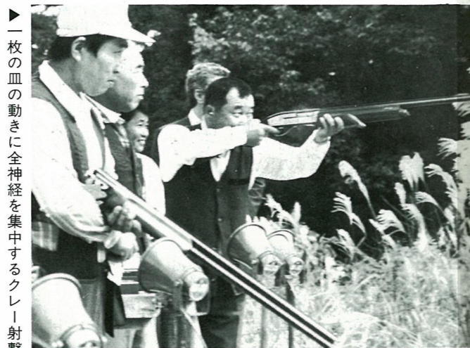
▶一枚の皿の動きに全神経を集中するクレイ射撃