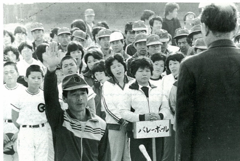
▲午前7時から新地小学校で行われた開会式

10月10日、新地小学校など町民が参加し、バレーボール、ソフトボールなど10種目に熱戦をくりひろげました。