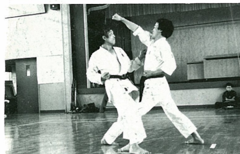
▲はじめて競技参加の空手、今年日頃の練習ぶりを型で披露