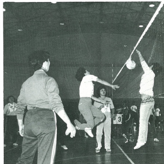
▶接戦が続いた婦人バレーボール