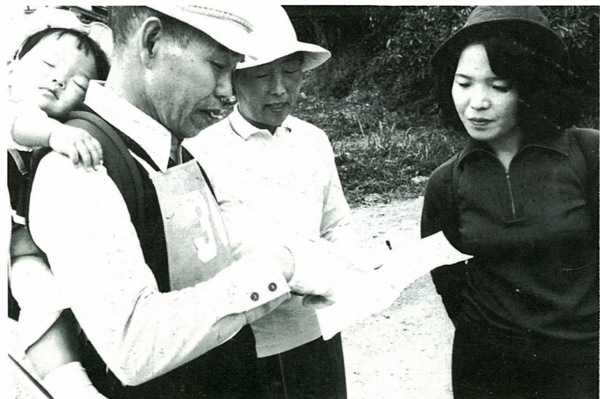
▲“私 もう疲れたの” 家族そろって参加のオリエンテーリング