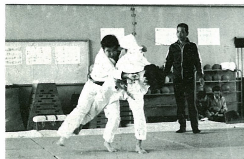
▲瞬間の技が勝負を決める柔道