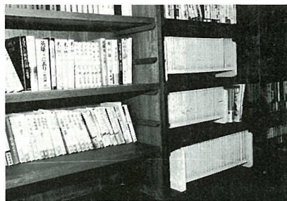
▲公民館図書がみなさんのご利用をお待ちです。

公民館では図書三千六百冊を備え、みなさんにご利用をお待ちしています。借出し図書は新地・駒ヶ嶺両公民館にそれぞれ備えてありますので、借入れを希望される方は、公民館開館時に係員にお申し出ください。