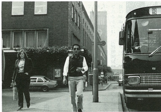
▲デュッセルドルフ(西ドイツ)の街並を散歩する筆者

筆者は海外研修に参加して一番の思い出は、九月一日スイスのルツェルンで迎えた誕生日でした。これまで何度かは誕生日パーティーを家族、友人で祝ってもらったことはあったが、こんなに印象深いものはありませんでした。それも、再び来る事ができるかどうかともわからないスイスのストリマホテルのレストランで、研修に参加し