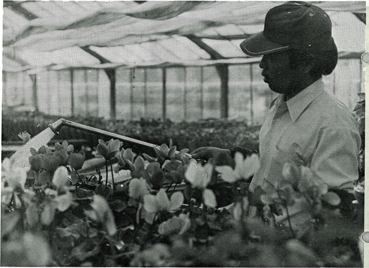
とじておきましょう。