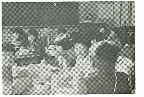
▶カレーライスに、舌つづみをつ生徒達(新地小にて)

委員会が実施を検討していた米飯給食が十一月二日から町内四カ所の小中学校で始まりました。 米飯給食は、パン給食に比べタンパク質が不足し、不足分を副食で補うため単価六円程度高くなりま