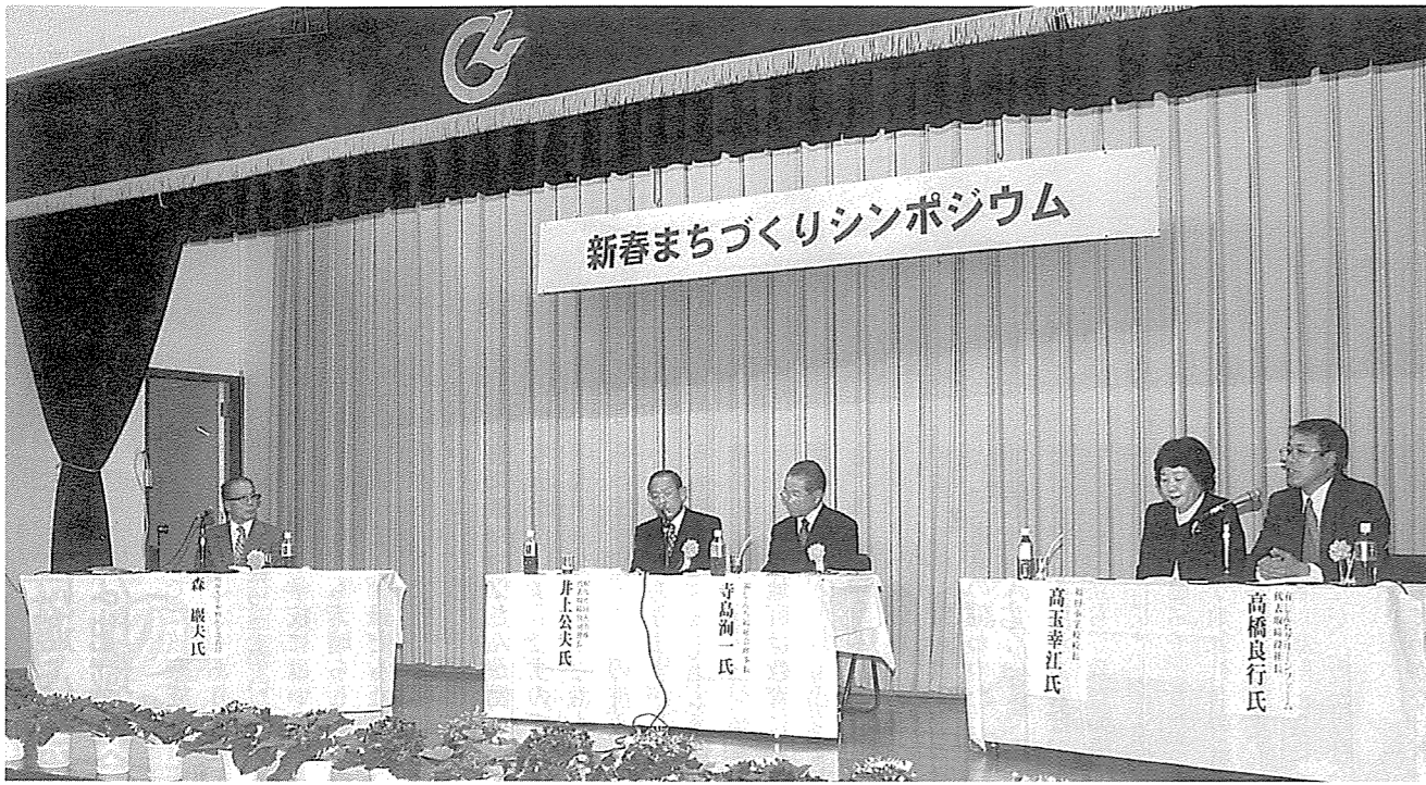
▲企業・福祉・教育・産業の各分野から豊かな地域社会に向けて意見交換がなされた

新地町で考えた場合、自然環境や、海や山の幸、あるいは人情の温かさ、観光資源などが恵まれており、それ自身が地域の資源となっていますので、それらのものを有機的に使い、魅力のある居住環境を整備していくことが大事だと思います。それには、そこに住む人たちが、自分たちの町のために何が出来たのかを考え、自発的に行動することが望ましく、自治体は、