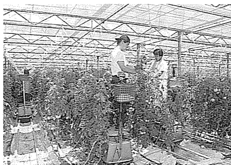
▲産業の振興が地域に活力を与える

カンを作れば、日本で一番早くできますよ」という発想でした。あるいは「共同火力さんからのエネルギーをもらって南国のパイアやマンゴーなどをつくれれば、良いものができるよ」という先生もいました。以前新地ではキウイ栽培などいろいろなことをやってきたという話を聞いています。そういった話を聞くと、まだまだ農業でも食べていけないのではないかなと思つています。「農業」という捉え方を、頭の「ち」で考えれば、まだまだ楽しいビジネスになるのではないかなと思つています。「農」に夢を持ちつつ、これからも頑張っていきたいと考えております。