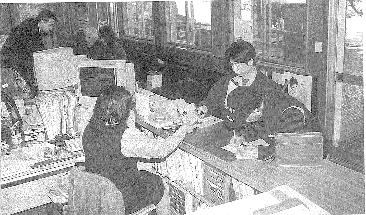
▲これからの時期、役場窓口は大変混み合います。時間に余裕を持ってお早めにおいで下さい