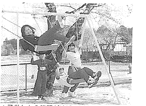
▲子供たちの笑顔が地域の活力となる

ないようです。例えば自転車走らせて観光地を一周できるルートを作ってみるなどすればおもしろいのではないのでしょうか。