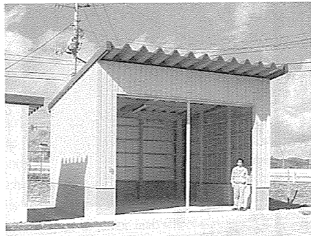
保管庫の大きさは36平方メートル。潰したペットボトル約5万本が保管できる施設です。

町では資源の有効利用を図るため、4月1日から新たに、ペットボトルの分別収集を始めることになりました。 ペットボトルの回収は、燃えないゴミの日に一緒に行いますので、専用のカゴに出してください。