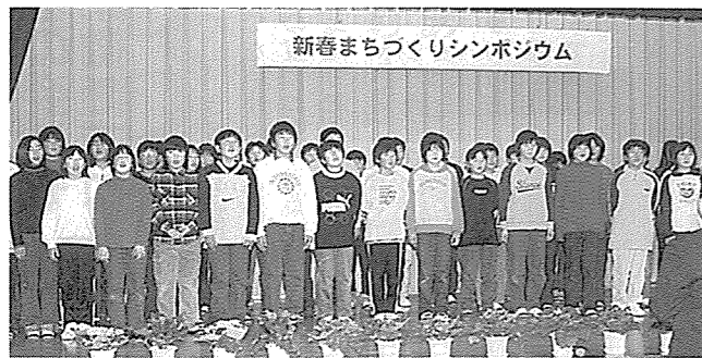
▲アトラクションでは新地小児童が素晴らしい合唱を披露

そのような人材を育てていけば良いかと思われれます。町内にも自発的な行動を行うグループがあるようですので、これらの芽を大きく育てていくことが必要だと思えます。