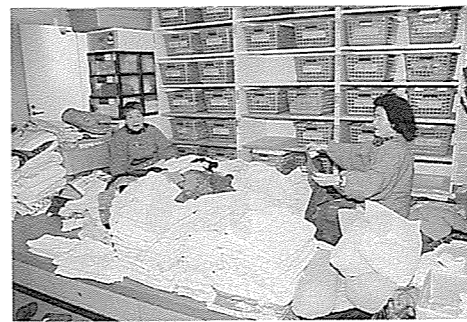
▲特別養護老人ホームには連日多くのボランティアが訪れる