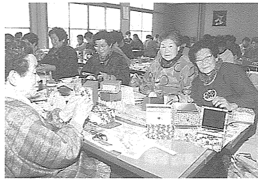
化粧箱を作り取り組む老人クラブの皆さん

老人クラブ女性部が手作りの寒中見舞い 町内の一人暮らしや寝たきりのお年寄りに手作りの日用品を贈り、毎日の暮らしに役立ててもらおうと、老人クラブ女性部ではこのほど、有志50人が集まり、厚紙と和紙、鏡を張り合わせて作った化粧箱を作り、150人に贈りました。 この手作りの寒中見舞いは、同クラブ有志によって毎年行われているもので、これまでもメガネ入れや写真立て、新聞入れなどを贈り、お年寄りからたいへん喜ばれています。