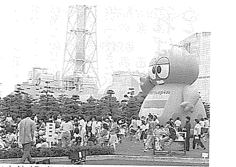
▲わくわくランドでは、毎月イベントを催し地域の活性化を図っている

ハート面についてですが、今後は、行政が皆さん方に何かをするのではなく、皆さん方が町のために何を考える時代になっていきますので、そういった意識改革も必要となってきます。新地町では、まちづくりのために百人委員会や地区別計画などを行っている、たいへん喜ばしいことだと思います。