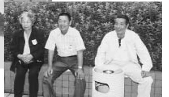
▲ ちよつとひと休み