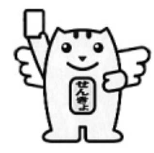
みんなの一票大切に!