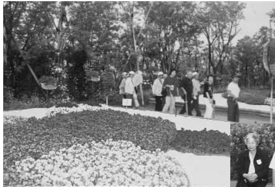
▲ 56haの広大な会場「浜名湖花博」