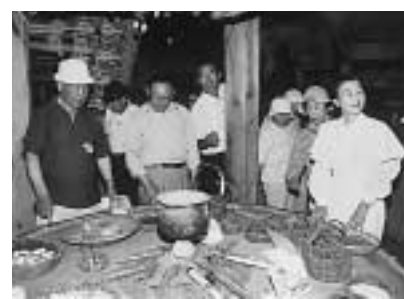
▲ 登呂遺跡・博物館を見学