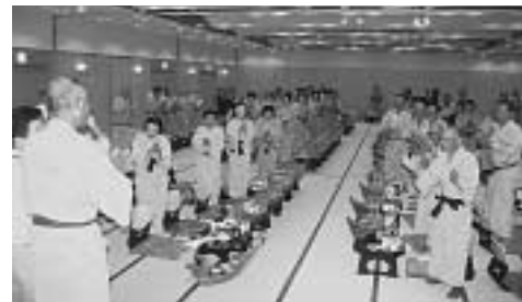
▲ 親睦を深めた懇親会