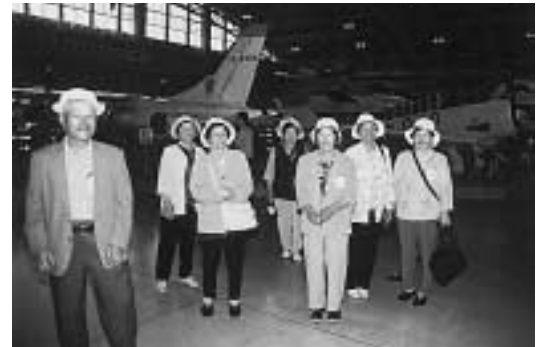
▲ 航空自衛隊浜松基地 浜松広報館を見学