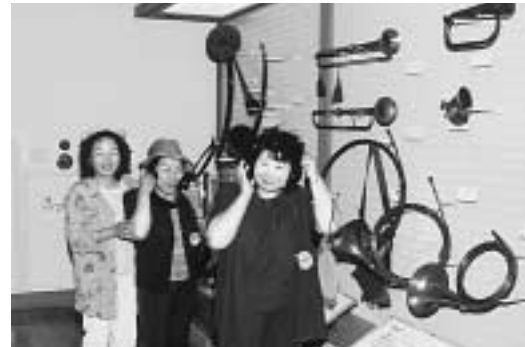
▲ 世界中の楽器が展示してある浜松市楽器博物館

第15回新地町民号は6月20日から22日までの2泊3日で行われ、参加した町民88名が、静岡県浜名湖花博を中心とした駿河路の旅を楽しみました。あいにく、メインとなる花博見学当日は、台風6号の接近で静岡地方は大荒れの天気となり、会場の一部しか見学できなかった。しかしながら、翌日は天候も回復し、参加者は静岡の景観地や名所・旧跡を見学し親睦を深めました。