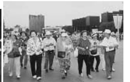
▲ 浜名湖花博会場散策