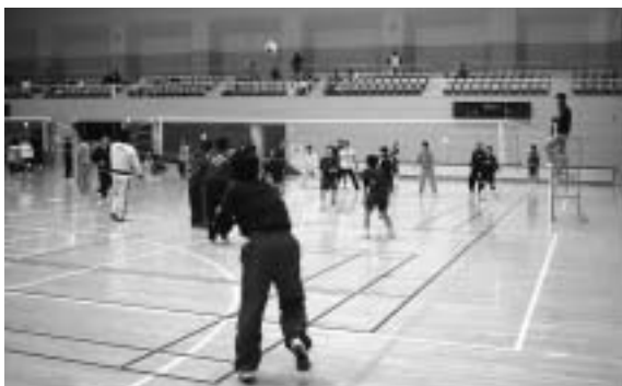
▲レベルの高い試合が行われました。