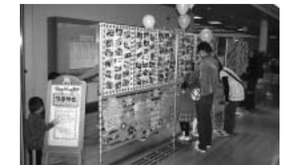
▲ 写真や「つぶやき」の展示

保育展は、各種行事の写真や、子どもたちの面白おかしい「つぶやき」の展示が行われました。