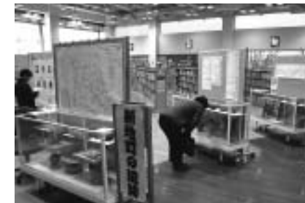
▲ 町郷土資料の展示