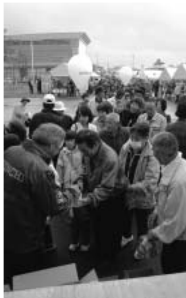
▲ 早朝から長い行列ができた先着プレゼント