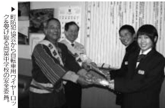
▶町防犯協会から自転車用ワイヤロックを受け取る尚英中学校の安全委員

海の安全と豊漁を祈願 5年に一度、海の安全と豊漁を祈願する安波津野神社の例大祭が11月3日、釣師浜漁港周辺で行われました。祭りでは、漁業後継者の若い衆が神輿(みこし)を担いで釣師・大戸浜を練り歩き樽神輿(たるみこし)に持ち替えた後は、冷たい海に入り、海の安全と豊漁を祈願しました。特設ステージでは、漁業関係者による演芸会のほか、漁協婦人部による鮭汁も振る舞われ、祭りを盛り上げました。