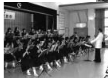
▲ 尚英中 プラスバンド部による演奏