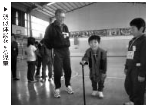
▶疑似体験をする児童

笑顔で、快護。見て、触れて、体験 町男女共同参画推進事業の一環として11月2日、福田小学校4年生と祖父母・老人会の介護体験教室が行われました。世代間交流、体験教室を通して、児童らが高齢者や障がい者の気持ちや不便さを感じ、その中で自分たちができることを考えてくれることを目的に開かれました。 体験教室では、児童らが目隠しやおもりを付けて、視力障がいや肢体障がいなどの疑似体験をしたり、いろいろな福祉用具を実際に使ってみたりしたほか、介護予防の手遊びなどを行いました。