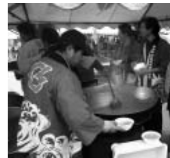
▲ 山海汁の無料配布