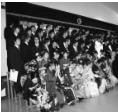
▲ 昨年の成人式の様子