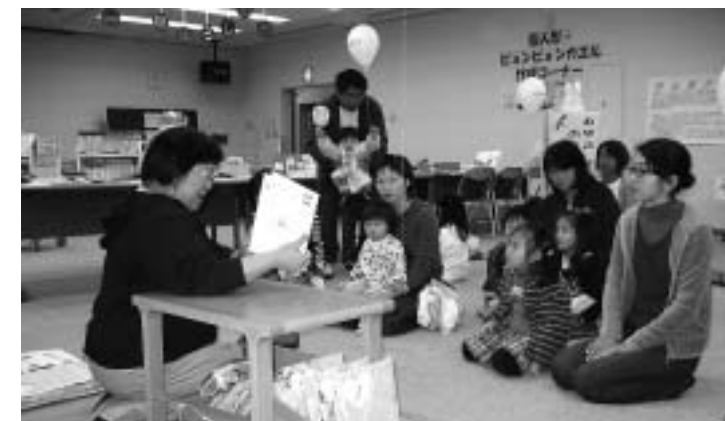
▲ 図書館ボランティア「スイミー」のみなさんによる読み聞かせが行われた親子ふれあい広場

このほか、除籍した図書等の配付、図書館行事の写真展示、クイズラリーが行われました。