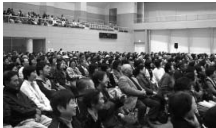
▲落語を楽しんだ来場者