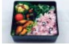
「黒豆ごはん弁当」 熊澤 静江(下真弓)