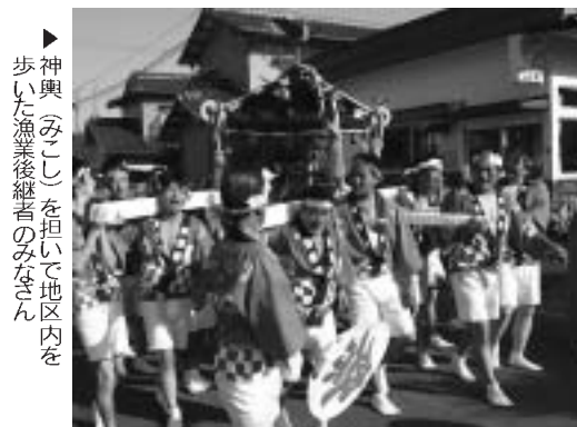
▶神輿(みこし)を担いで地区内を歩いた漁業後継者のみなさん

笑顔で、快護。見て、触れて、体験 町男女共同参画推進事業の一環として11月2日、福田小学校4年生と祖父母・老人会の介護体験教室が行われました。世代間交流、体験教室を通して、児童らが高齢者や障がい者の気持ちや不便さを感じ、その中で自分たちができることを考えてくれることを目的に開かれました。 体験教室では、児童らが目隠しやおもりを付けて、視力障がいや肢体障がいなどの疑似体験をしたり、いろいろな福祉用具を実際に使ってみたりしたほか、介護予防の手遊びなどを行いました。