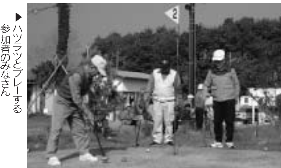
▶ハットとブレザーを着た参加者のみなさん

「二重ロック」で盗難防止 町防犯協会では、近年における自転車等の盗難件数が増加傾向にあることから、10月26日を「二重ロックの推進日」とし、同日、盗難防止を呼びかける防犯活動を行いました。 当日は、尚英中学校の生徒に自転車用ワイヤロックを配付、また、新地駅で鍵かけの状況や施錠の普及率調査、ワイヤロック、ストラップの配付をしたほか、広報車で町内を巡回し防犯を呼びかけました。