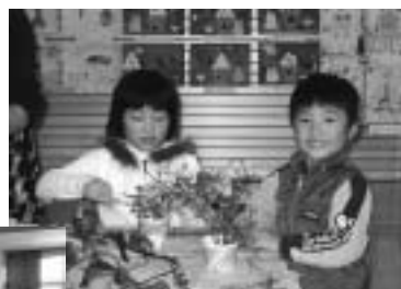
▲ 生け花体験コーナー