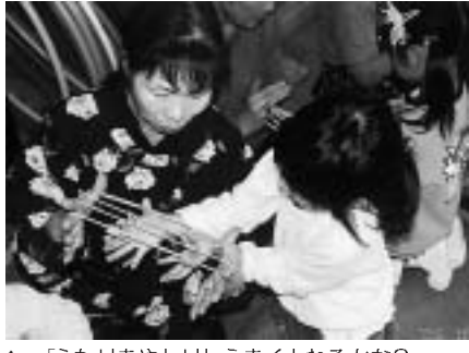
▲「ふたりあやとり」うまくとれるかな？

福田保育所では、一昨年から「伝承あそびを通して豊かな人間関係を育てる」をテーマにした研究に取り組んできました。そのなかで、あやとりが大人気で、子どもたちは今でも楽しく遊んでいます。