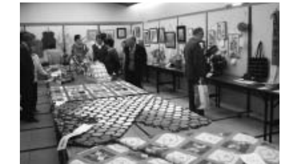
▲ 高齢者の方の作品展示