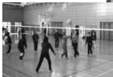
▲町内をパレードし、防火を呼びかけました。

また、町女性消防隊防火ソフトボール大会が11月26日に新地小学校の体育館で行われ、6チーム約70人の隊員が親睦を図りました。