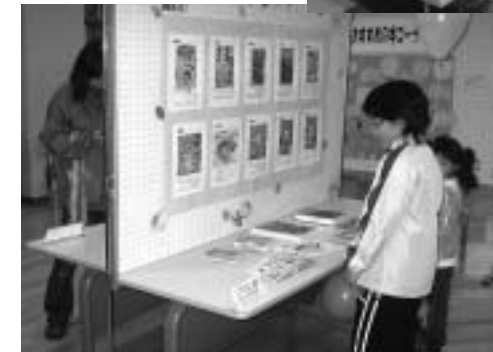
▲ 図書館ベストリーダの展示