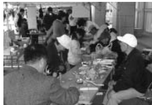
▲ 木工クラフト体験教室