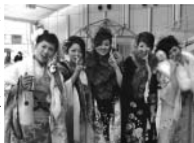
▲年金を支えるのは若い世代の力です。(写真：今年1月の成人式)