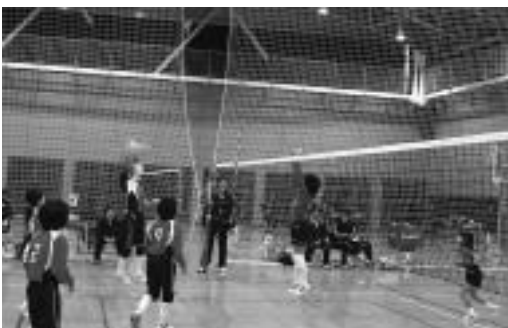
◆日頃の練習の成果を競った選手ら

町スポーツ少年団バレーボール大会が2月18日、新地小学校体育館で行われました。 大会には、町内の4つのジュニアバレーボールクラブが出場。6年生、5年生の学年別にリーグ戦を行いました。 熱戦の結果、両部門において尚英カッツJVCが優勝しました。