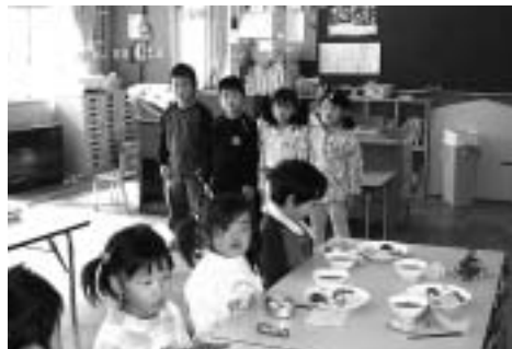
▲みんな揃って大きな声で「いただきます〜す!」

初めて保育所に入った子どもが、家に帰って必ずする「こと」があると思います。それは、家族が食卓に揃って、おもむろに前に出て行き「手を洗って、お揃いでいただきます!」とお揃いで「いただきます!」とかけ声を掛けることです。