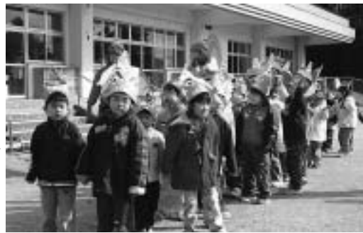
手作りの鬼のお面をかぶって行進

相馬共同火力で防災訓練 相馬共同火力発電所では2月15日、協力会社などと合同で防災訓練を行いました。 訓練は、相馬沖を震源とする震度6強の地震が発生、タンクから重油が漏れだしたと想定。社員など約200人が参加しました。避難訓練や救護訓練、自衛消防隊と広域消防新地分署員による一斉放水などが実施されました。