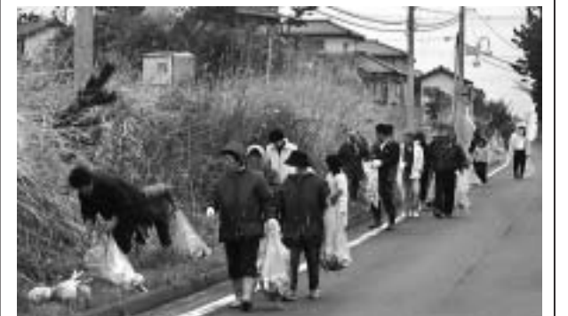
▲ 昨年の環境美化運動の様子