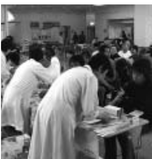
▲ 昨年の健診の様子

年に一度の健診が、みなさんの健康を守ります。自分の生活習慣を見直すきっかけとして活用しましょう。