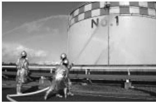
機敏な動作で放水訓練を行う自衛消防隊員

相馬共同火力で防災訓練 相馬共同火力発電所では2月15日、協力会社などと合同で防災訓練を行いました。 訓練は、相馬沖を震源とする震度6強の地震が発生、タンクから重油が漏れだしたと想定。社員など約200人が参加しました。避難訓練や救護訓練、自衛消防隊と広域消防新地分署員による一斉放水などが実施されました。