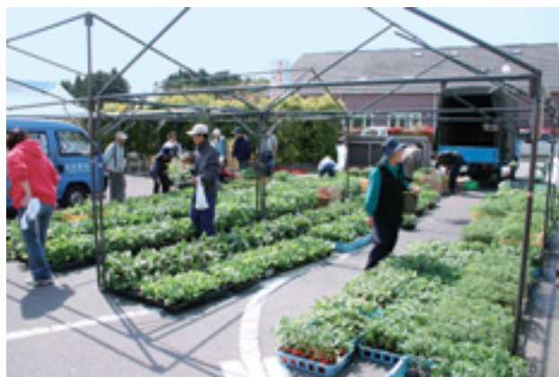
▲ 今年も花、野菜など各種とりそろえています