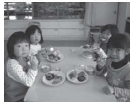
▲みんな仲良く「いただきます!」

友達と一緒に楽しく食べる給食は、体の栄養をとるだけでなく、心にも栄養補給をして、子どもの心と体を豊かにしてくれます。