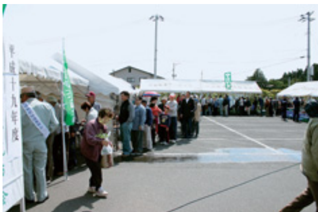
▲ 緑化苗木配布に長い列