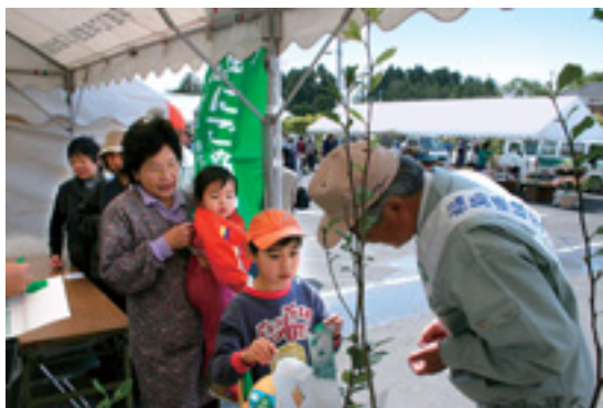
▲ 昨年の種苗市の様子

12:00~ ビンゴゲーム大会 18日(9時~12時まで)に買い物された方にもれなくビンゴカードをプレゼントします。