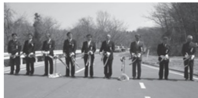
▲テープカット(丸森町大内地区で)

鈴宇線の新地町側・丸森町側には多くの観光資源があります。 夏場には福島県の県北地方を始め、丸森町、角田市、白石市方面からも多くの人が訪れる釣師浜海水浴場もあり、交流人口の増加が期待されています。