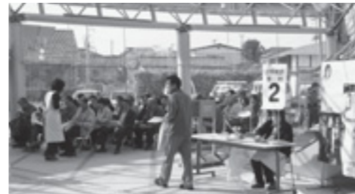
▲ 昨年の総合健診の様子

なお、9月対象者の方でやむを得ない事情がある場合は変更できますが、40歳～74歳の社会保険の被扶養等の方は「受診券」が手元にないと特定健診が受診できませんので、お気をつけください。