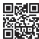
登録用アドレス QRコード