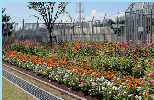
▲石油資源開発株式会社