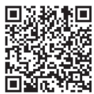
福島県警察本部 ホームページ (POLICE ふくしま)