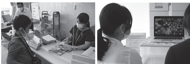
▲自分のカードで貸出体験

9月14日(火)には、ZOOMを使って、疑問に思ったことや、知りたいことを質問してもらいました。