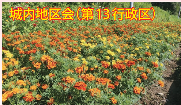
城内地区会(第 13 行政区)