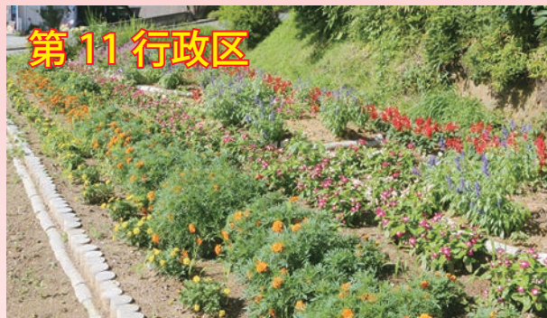
第 11 行政区