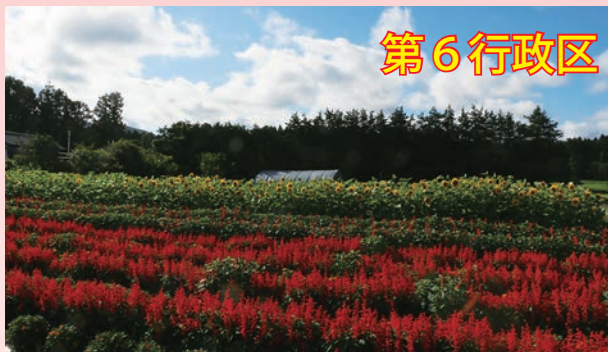
第 6 行政区