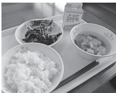
▲不検出の場合給食へ