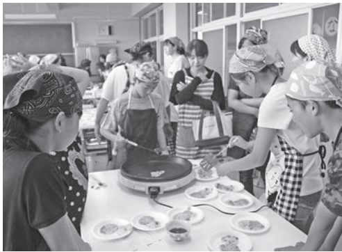
▶地元産小女子・たこ・にらのチヂミづくり

地元の食材を知ってもらうために、昨年度は相馬双葉漁業協同組合新地婦人部による「地元産小女子・たこ・にらのチヂミづくり」や地元おさかなマイスターによる「郷土料理ほつきご飯づくり」等の食育講座を開催し、地場産物を使用した郷土料理などを地域の方とともに料理し、みんなで