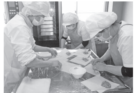
▲手作り春巻き 地元産のねぎが入った具を一つひとつ丁寧に包みます。