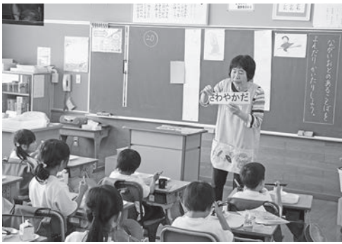
▲給食の時間に教室を回り今日の食材について説明しています。

そこで町教育委員会では「新地の子どもはさわやかだ」をスローガンに、食を中心とした生活習慣の改善による健康課題の解消をテーマに、学校・家庭・地域がつながり、食の力で元氣な新地町を目指して、食育を推進しています。