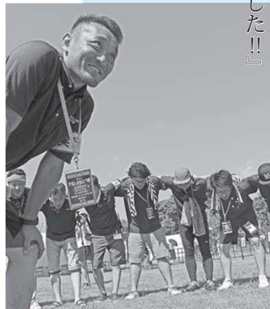
◀最後のやるしかねえべ祭に向け気合を入れる目黒実行委員長