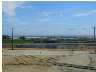
乗換こ線橋から海側の風景