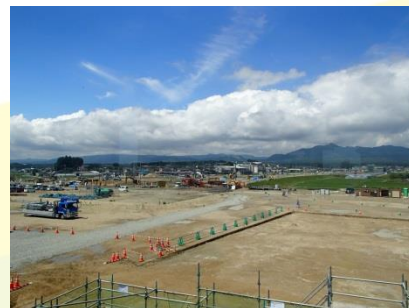
乗換こ線橋から山側の風景