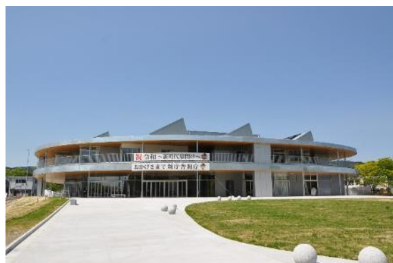
山元町役場新庁舎