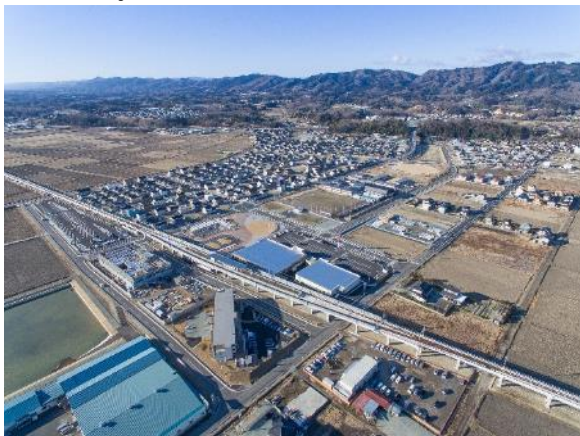
つばめの杜地区（新山下駅周辺地区）

8年の復興計画期間が終了し、令和元年12月に第6次山元町総合計画を策定、町の将来像「キラリやまもと！みんなでつくる笑顔あふれるまち」を実現するため各種事業に取り組んでいる。