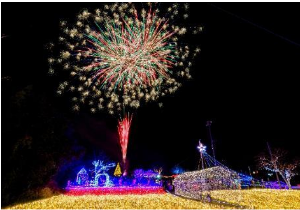
手作りイルミネーションコダナリエ