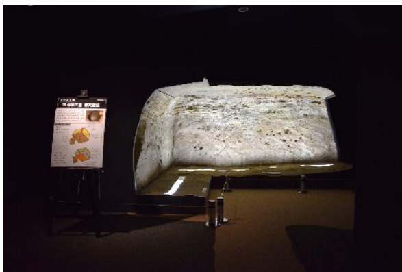
古代のお墓などの壁に線を刻んで描かれた1400年前の「線刻壁画」