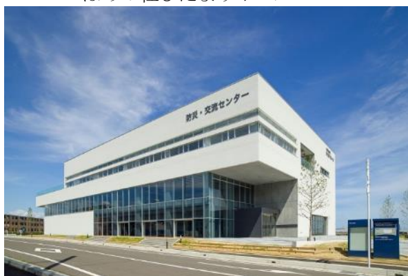
つばめの杜ひだまりホール