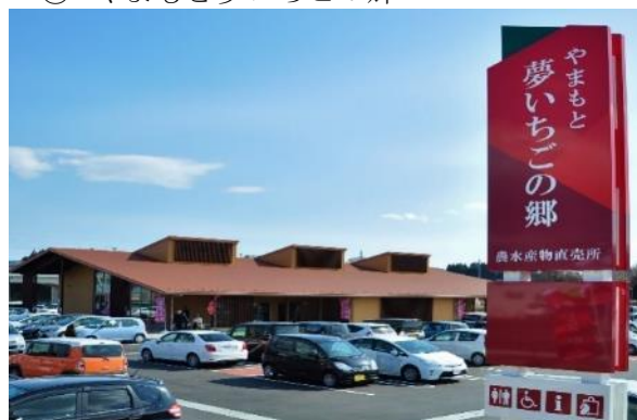
やまもと夢いちごの郷