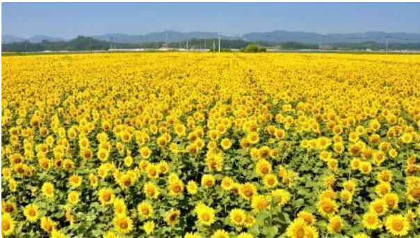
5. 5haの広大な農地に咲き誇るひまわり