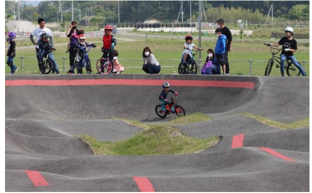
▲しんちパンプトラック