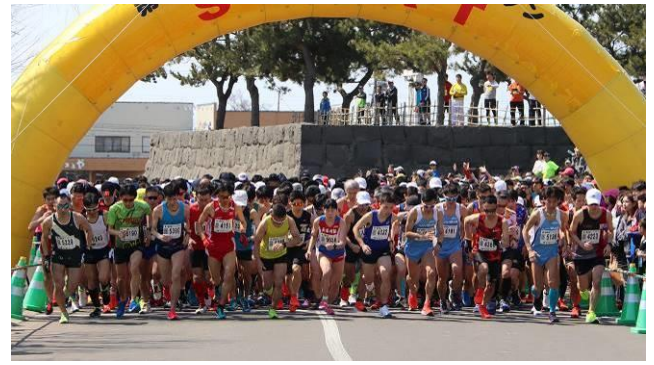
春一番伊達ハーフマラソン