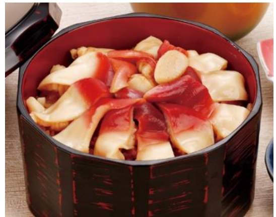
地元民が愛する郷土料理「ほっきめし」