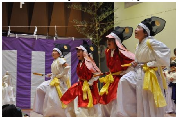
受け継がれる「坂元子ども神楽」