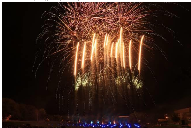
伊達150年記念花火大会