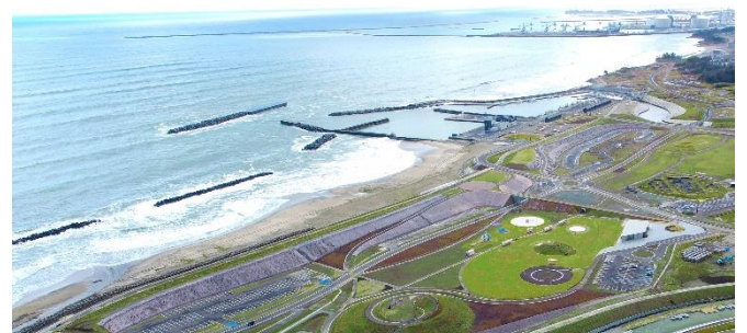
▲ 釣師防災緑地公園