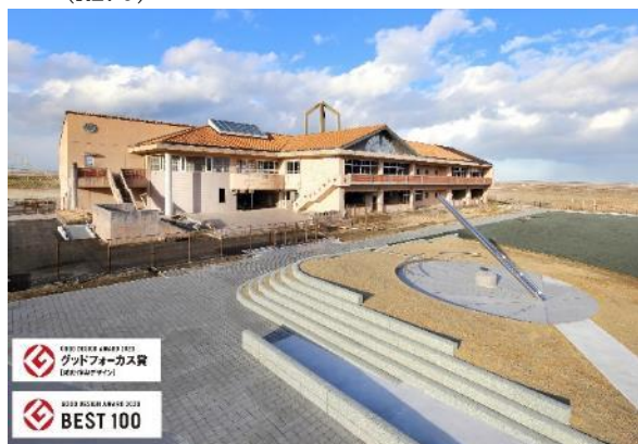
震災遺構中浜小学校