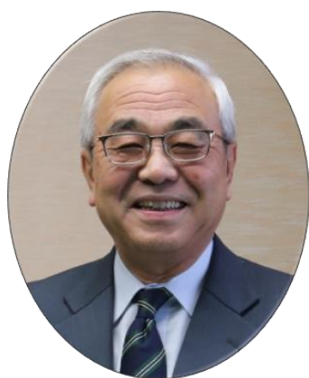
伊達市長 菊谷 秀吉