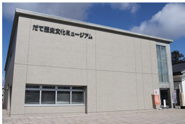
だて歴史文化ミュージアム