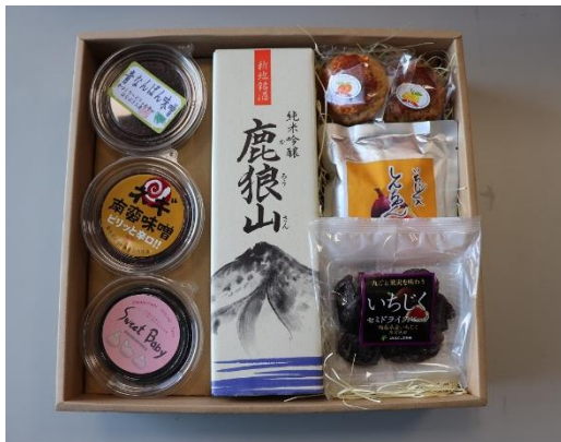
▲特産品詰め合わせセット