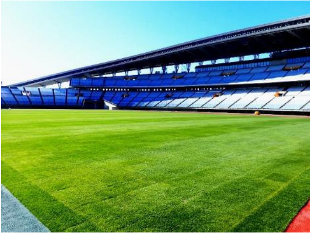
復興芝生が採用された宮城スタジアム