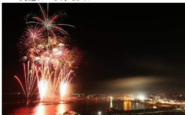
夜空を彩る流灯花火