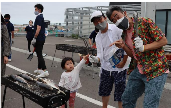
▲遊海しんち (浜焼きの様子)